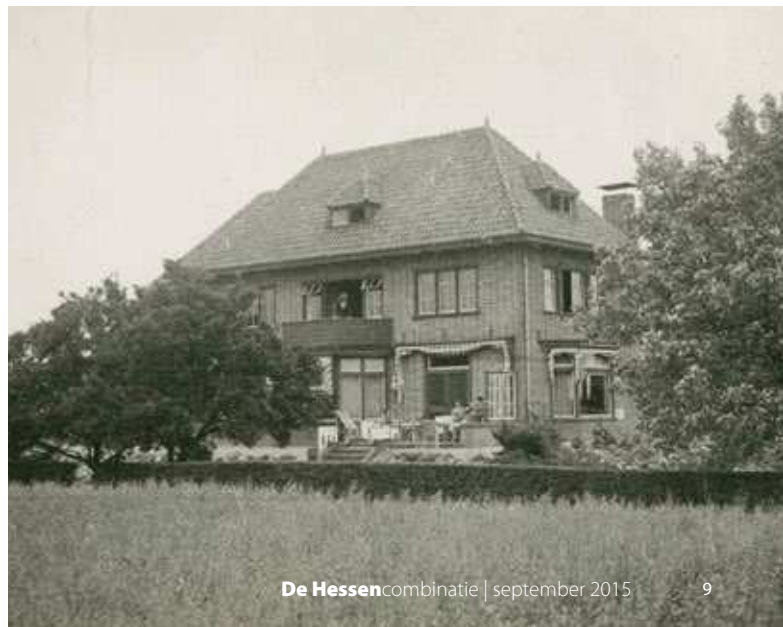
Het Zand in of vlak voor de oorlog